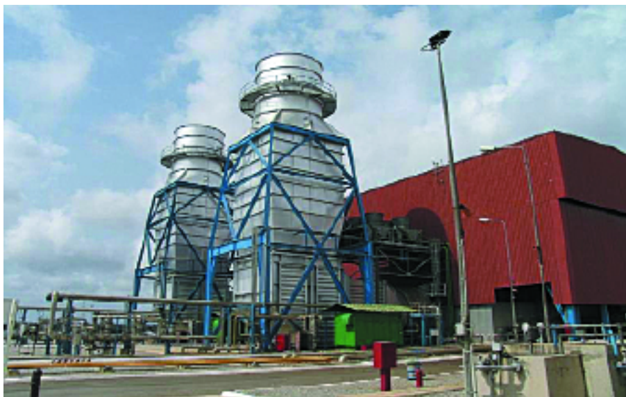
Centrale thermique d'Azito, Côte d'Ivoire