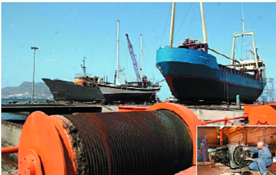
Chantier naval de Mindelo