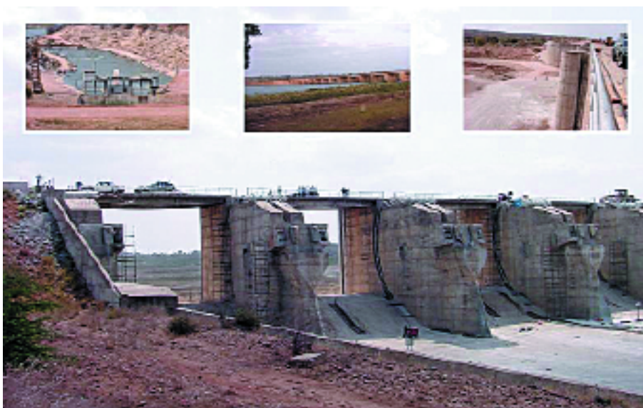
Réhabilitation du barrage et des petites exploitations agricoles de Massingir, Mozambique