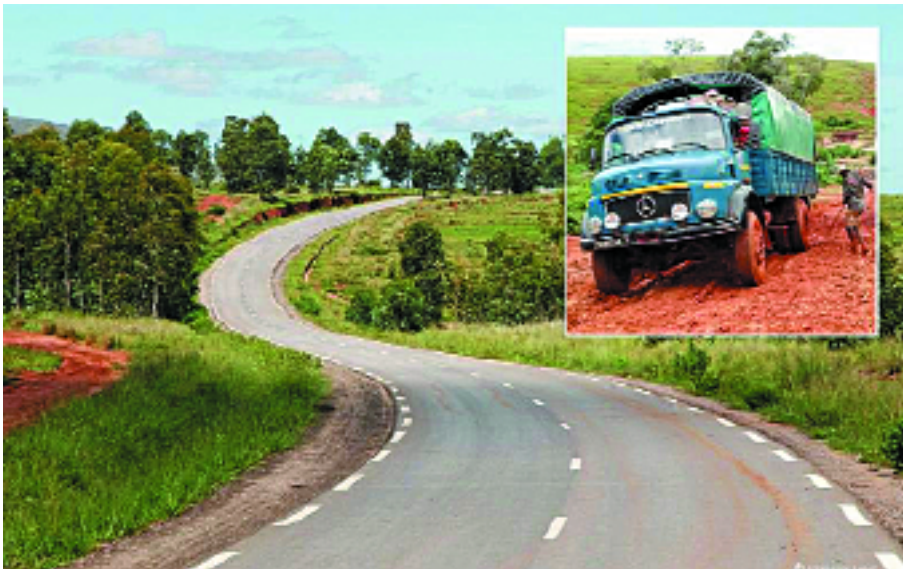
Réhabilitation de route nationale (RN 1 bis), Madagascar

N.B Le Mémoire relatif à la demande d'un concours financier de la part du Fonds spécial FPPI-NEPAD ne devra pas excéder 15 pages, annexes comprises.