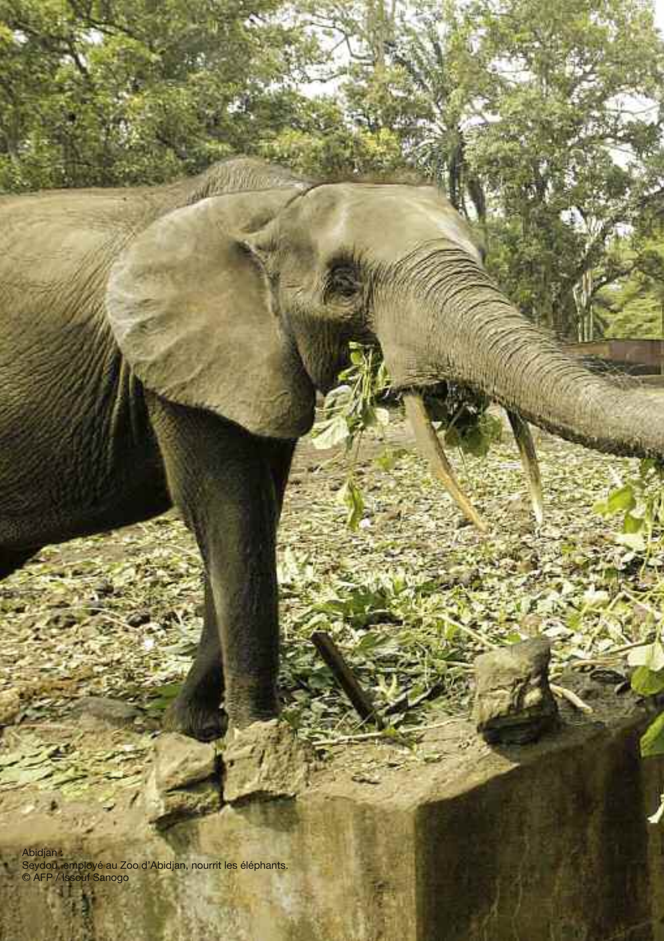
Abidjan : Seydou, employé au Zoo d'Abidjan, nourrit les éléphants.