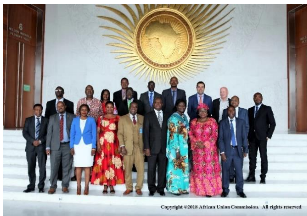
Participants à la 6 e réunion du Conseil d'administration du MAFDE au cours du second semestre de 2018.

Il a été demandé au Groupe de travail d'aider le Secrétariat du MAFDE à finaliser : le programme de travail 2019 du MAFDE, l'étude de faisabilité sur la garantie de crédit pour le financement des engrais en Afrique, et l'étude de l'état des lieux. Dans cette perspective, le Groupe de travail s'est réuni à Kigali (Rwanda) lors du Forum sur la révolution verte en Afrique (AGRF), le 4 Septembre 2018. D'autres échanges sur le même sujet se sont poursuivis par voie électronique. Les réalisations du groupe de travail sont présentées dans différentes sections du présent rapport.